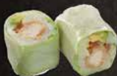
Fresh Saiko 12.00 Beignet de poulet