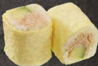
Thon mayo avocat 7.00