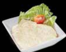
Chirashi Daurade x12 18.50