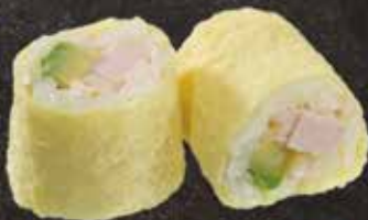
Dinde mayo avocat 8.00