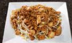
Nouille poulet 11.00 Poulet Tempura 11.00