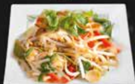
Shop Suey Boeuf 14.50