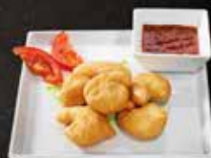
Beignets de crevettes *