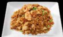
Riz sauté beignets de poulet 11.50 Poulet Tempura 12.50