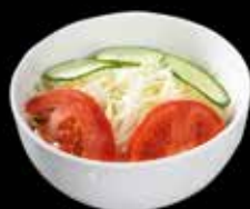
Salade de choux 4.00