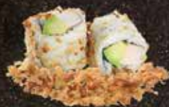
Dinde mayo avocat 8.00