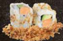
Saumon cuit avocat 8.50