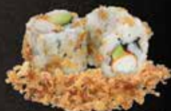
Surimi avocat 7.50