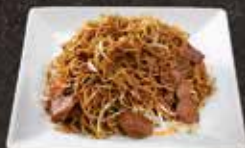
Nouille boeuf 12.00 Boeuf piquant 12.50