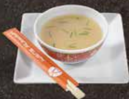
Soupe Miso 5.00 Soupe Légume 4.50