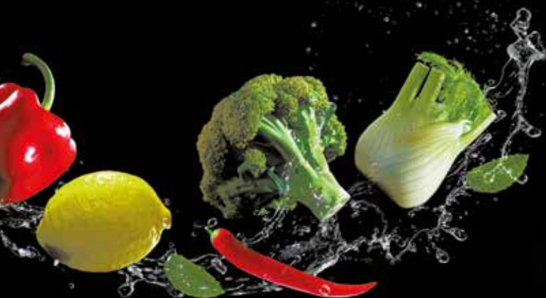
Salade d'algues 6.00

tomates cerise, saumon, thon daurade, sésame