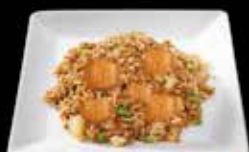
Riz sauté saumon 11.50 Saumon Tempura 12.50