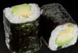
Avocat 4.50 Concombre 4.00