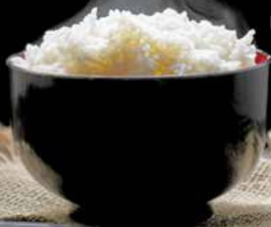
Riz vinaigré 4.50