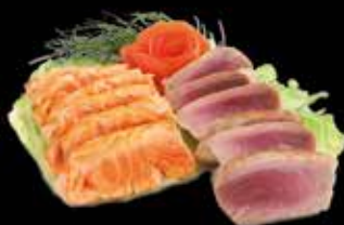
Sashimi mi-cuit x6 12.00 x12 20.00