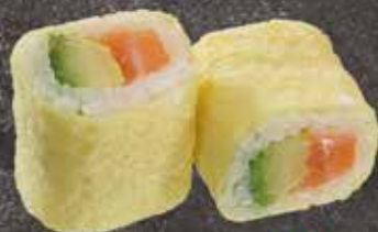
Saumon avocat 7.50

TOUS LES CALIFORNIA EGG SONT SERVIS PAR 6