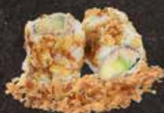
Thon mayo avocat 7.50