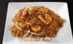
Nouille crevettes * 11.00