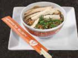
Soupe nouilles 8.00 Soupe vermicelles 8.50 au poulet