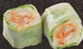
Fresh nem 12.00