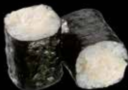
Poulet mayo 5.00