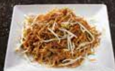
Nouille légumes * 9.00 Nouille Shop Suey 9.50