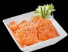
Chirashi Saumon x12 18.00