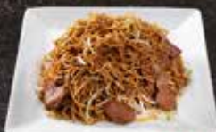
Nouille thon 12.50