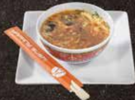
Potage pékinois 8.00 Soupe de poisson 10.00