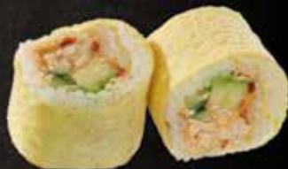
Chicken x8 11.00