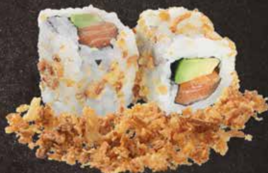
Saumon avocat 7.50

TOUS LES CALIFORNIA ONION SONT SERVIS PAR 6