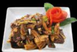
Poivre noir 14.50