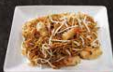
Nouille cabillaud 14.00