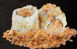
Thon mayo harissa 7.50