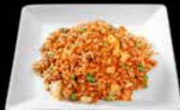
Riz Loc Lac 8.50