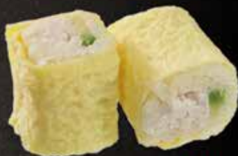
Poulet mayo avocat 7.50