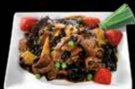
Champignons et pousses de bambou 14.50