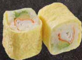
Surimi avocat 7.50