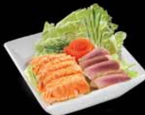
Chirashi mi-cuit x12 22.00