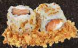
Saumon cheese* 7.50