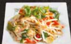
Shop Suey Légume 8.50