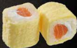
Saumon cheese * 7.50