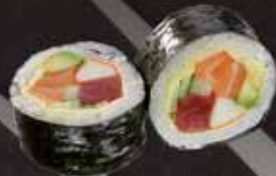
Futomaki x8 saumon - thon - avocat - surimi 11.00