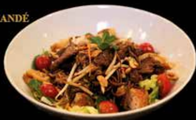
Salade Bò bún (hors menu)