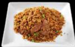
Riz sauté au boeuf 11.50 Boeuf piquant 12.00