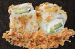
Concombre cheese* 7.50