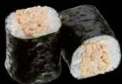
Thon mayo 5.00