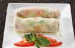
Rouleau de Printemps