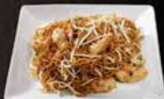
Nouille beignets de poulet 11.50