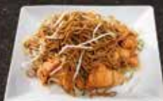
Nouille saumon 11.50 Saumon Tempura 11.50