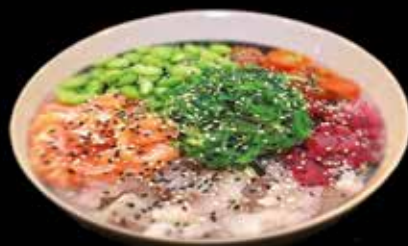
Salade Sakana 18.50

Iceberg, soja, carottes, concombre, tomates cerises, cacahuètes, nems, nouilles, menthe