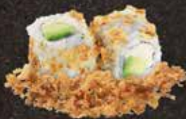
Poulet mayo avocat 7.50