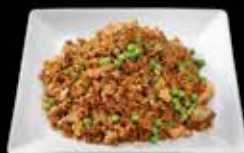
Riz sauté au poulet 11.00