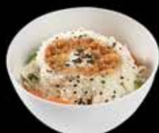
Salade de choux 8.00

oignons frits, tartare de saumon oignons frits, poulet mayo oignons frits thon mayo