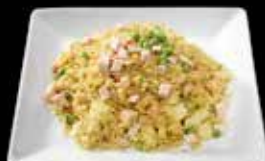
Riz curry 9.50 A l'ail 8.50