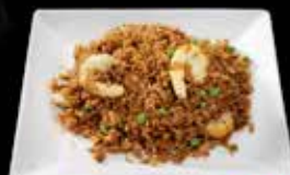
Riz sauté crevettes * 11.50 Riz sauté thon 12.50 Riz sauté cabillaud 14.00