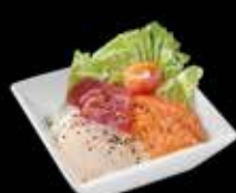
Chirashi Mixte x12 19.50