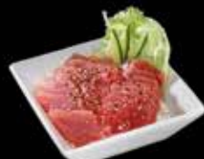
Chirashi Thon x12 19.50