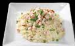
Riz cantonnais 9.00 Riz légumes 9.50