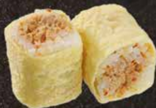
Thon mayo harissa 7.00