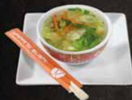
Soupe raviolis 9.50